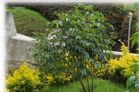
¡Así han ido creciendo los árboles sembrados en el marco de la Semana por la Paz 2019!